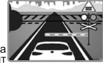
Филиал ОАО «РЖД»

Юго-Восточная железная дорога напоминает: нарушение правил дорожного движения на переездах угрожает жизни и здоровью самих водителей, а также пассажиров поездов, членов локомотивных и поездных бригад.